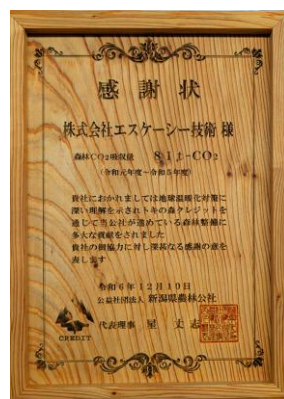
12月10日 感謝状贈呈 株式会社エスケーシー技術様