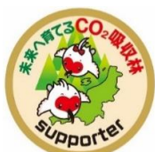
トキの森クレジットステッカーデザイン

・トキの森クレジットやロゴマークに関するお問い合わせ先 森林・林業課 カーボン・オフセット担当 TEL:025-285-7711 E-mail:rinsei@niigata-nourin.jp