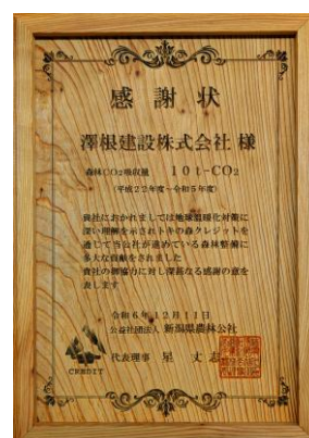
12月11日 感謝状贈呈 澤根建設株式会社様