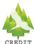
トキの森クレジットのロゴマーク